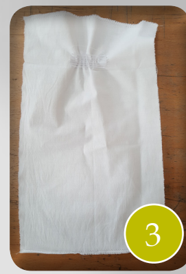
positie neuselastiek 5cm van boven/midden, vaststikken