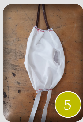
4x lint van 40 cm voor model met linten (zie foto 6), 2x elastiek van 18 of 22cm afhankelijk van gewenste grootte