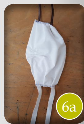
positie opening eerder bovenaan, opstikken linten in de vier hoeken en masker plooiën geven op 3 plaatsen links en rechts om het mooi te kunnen opentrekken bij gebruik