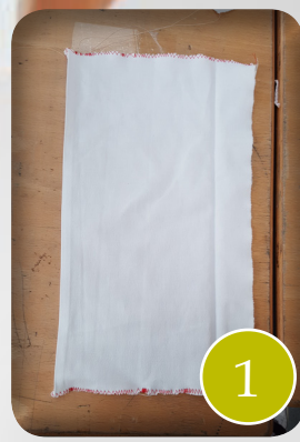
stof van 22cm/35cm