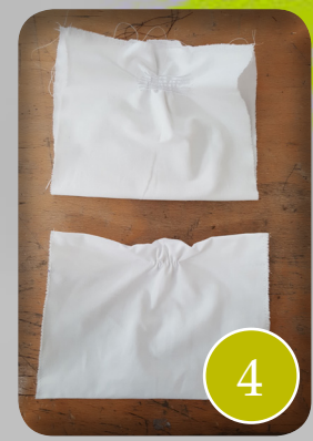
dubbelfvouwen en samen stikken, (opening houden bovenaan voor extra filter te kunnen voorzien bij gebruik)